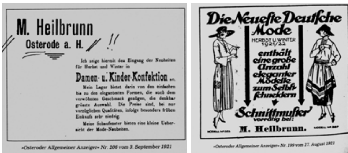
Abb. 4.1.c „Osteroder Allgemeiner Anzeiger“ Nr. 199 vom 27. August 1921 und Nr. 206 vom 3. September 1921

Eine weitere Spur der Familie Heilbrunn findet man aus dem Jahr 1921 in Anzeigen eines Modegeschäftes in Osterode/Harz.