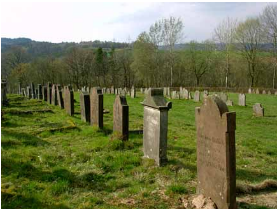
Abb. 5.1a Der Sammelfriedhof in Binsförth 52

Sammelfriedhöfe entstanden in der Regel aus der Not heraus, dass der reguläre Erwerb von Grund und Boden für Juden bis ins 19.Jhd. hinein stark begrenzt war. Sie lagen meist auf landwirtschaftlich nicht nutzbarem Gelände weit außerhalb der Bebauungen.