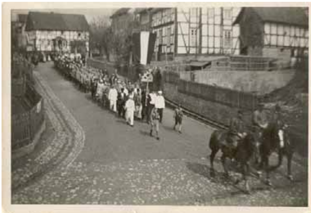
Abb. 2c Außenansicht der Synagoge im Jahr 1933 7

In der Entschädigungsakte 8 findet sich eine Grundrisssskizze die zeigt, dass sich im unteren Bereich des Versammlungsraumes 51 Sitzplätze für die Männer befanden und auf der Empore 40 Sitzplätze für die Frauen und Kinder. Außerdem sieht man den nach Osten ausgerichteten Thoraschrein und ein Tauchbad ( Mikwe ) im Eingangsbereich des Gebäudes.