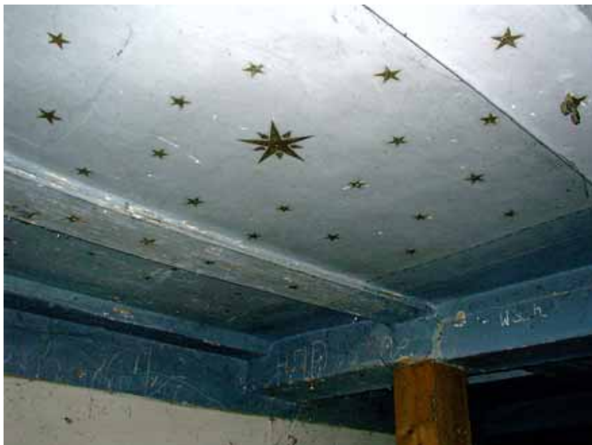
Abb. 2b Die sorgfältig gestaltete Decke des Versammlungsraumes heute 4

der evangelischen Kirche am Ort erinnert, der auch diese Merkmale trägt. Die Gestaltung der Wände und der Decken der jüdischen Betsäule wurde üblicherweise im Stil der jeweiligen Zeit und des Ortes ausgeführt und war abhängig von der wirtschaftlichen Situation der jüdischen Gemeinde. Da die Synagoge als Ort der Versammlung und als geistiges Zentrum eine große Bedeutung für die jüdische Ortsgemeinde hatte, war ihre Ausstattung „Gegenstand liebevoller Bemühung“ 3 .