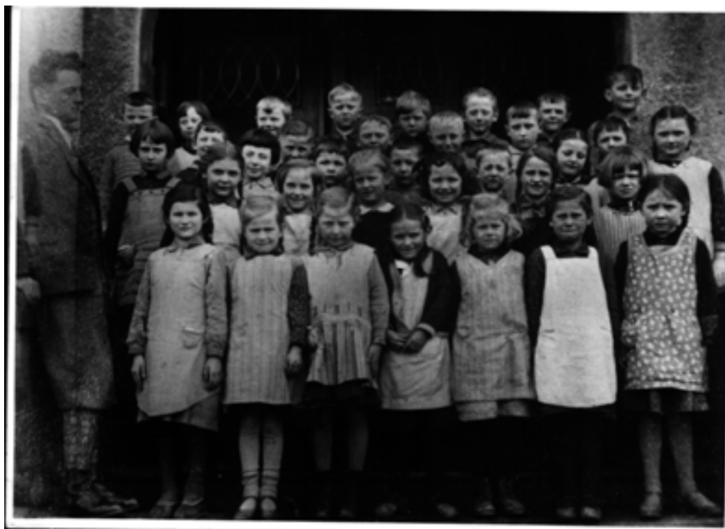
Abb. 9.1a Einschulung in die Volksschule Heinebach 1932 103

In Heinebach besuchten seit Schließung der jüdischen Schule in 1912 auch die jüdischen Kinder den Unterricht an der Lindenschule. In der Klasse des Geburtsjahrgangs 1925/26, der in 1932 eingeschult wurde, waren dies beispielsweise drei jüdische Mädchen unter insgesamt 34 Kindern. Nach der neuen Verordnung bedeutete dies, dass alle drei nur die ersten Schuljahre unbeschwert mit ihren Alterskameraden lernen durften. Im Jahr 35/36 mussten sie die Lindenschule verlassen und konnten nicht mehr am Unterricht teilnehmen.