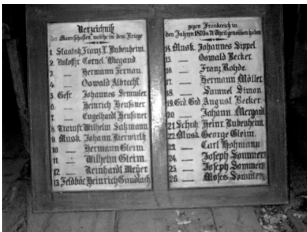
Abb. 6.1.3b Ehrentafel der Teilnehmer aus Heinebach am deutsch-französischen Krieg 1870/1871 85