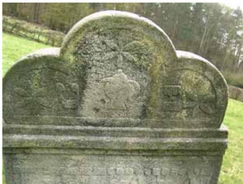
Abb. 5.3a Der Wasserkrug als Zeichen des Stammes Levi 62

Die Grabsteine stehen nach Osten in Richtung Jerusalem gerichtet in dichten Reihen nebeneinander. Verschiedene Motive bei der Gestaltung verweisen auf die Herkunft und die religiöse Aufgabe des Verstorbenen. So findet man beispielsweise Segnende Hände als Zeichen der Abstammung von dem Priesters Aaron, was sich teilweise auch in dem Namenszusatz ha-kohen widerspiegelt. Oder der Grabstein zeigt einen Wasserkrug , wie er zur Handwaschung benutzt wurde als Zeichen der Abstammung aus dem Stamm Levi mit dem Namenszusatz ha-levi . Ein Löwe deutet auf die Abstammung aus dem Stamm Juda und selten findet man das Grab eines Mohel , das mit den Beschneidungsgeräten ( Haltezange , Messer ) verziert war. Die Palme ist ein Ritualgegenstand beim Laubhüttenfest und das Horn erinnert an das Schofarhorn , das am Neujahrsfest geblasen wird. 61