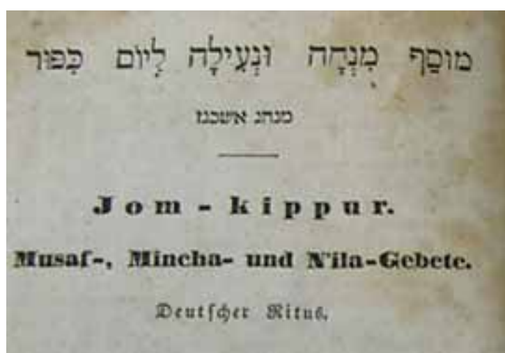
Abb. 5.4b Gebetbuch für Jom-Kippur 68

Da in dem besagten Haus den Listen nach keine Juden gelebt haben, könnte das Buch aus dem Nachbarhaus Sommer stammen oder aber, was ich für wahrscheinlicher halte, aus der Synagoge. Vielleicht ist es im November 1738 vor dem Verbrennen gerettet worden und der damalige Hausbesitzer hat seinen Namen hinten (aus hebräischer Sicht) mit Bleistift eingetragen.