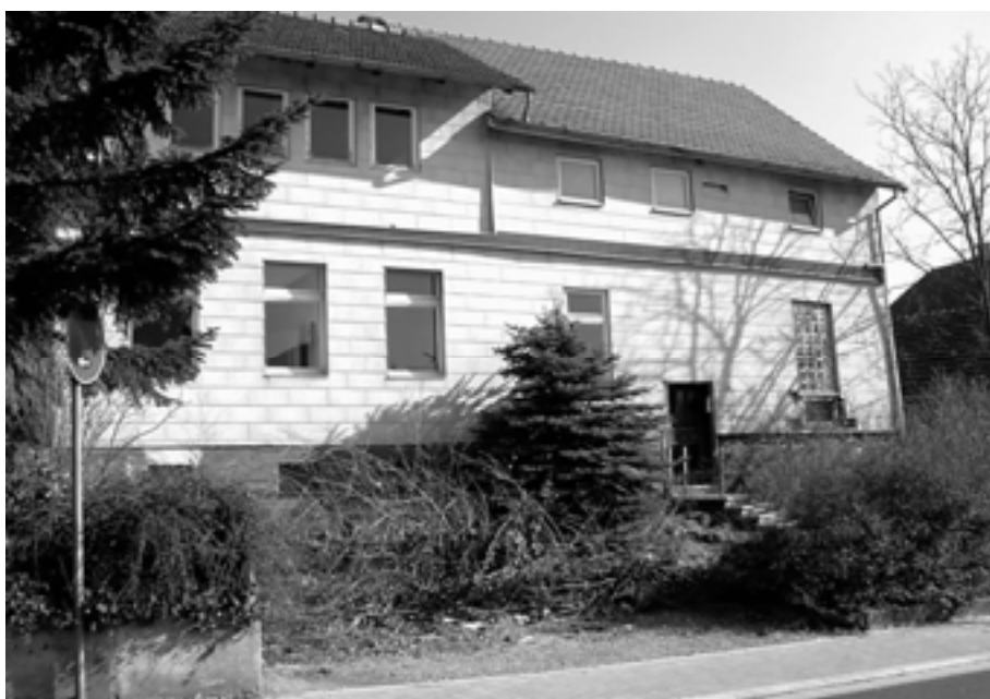
Abb. 2a Die ehemalige Synagoge heute 2

In Heinebach ist das Gebäude der ehemaligen Synagoge in der Eisfeldstraße scheinbar der letzte sichtbare Hinweis auf die frühere jüdische Gemeinde, die hier seit Jahrhunderten lebte. Es steht inmitten von Wohnhäusern im alten Ortskern und es fällt auf durch seinen verwahrlosten Zustand und den mit Müll und Grünabfällen bedeckten Eingangsbereich. Das Haus ist wie die meisten benachbarten Gebäude auch in Fachwerkbauweise zweigeschossig errichtet. Die Frontseite wurde ca. 1975 mit grauen Asbestzement-Platten verkleidet und wird bis heute von den Einwohnern des Ortes „Die Judenschule“ genannt.